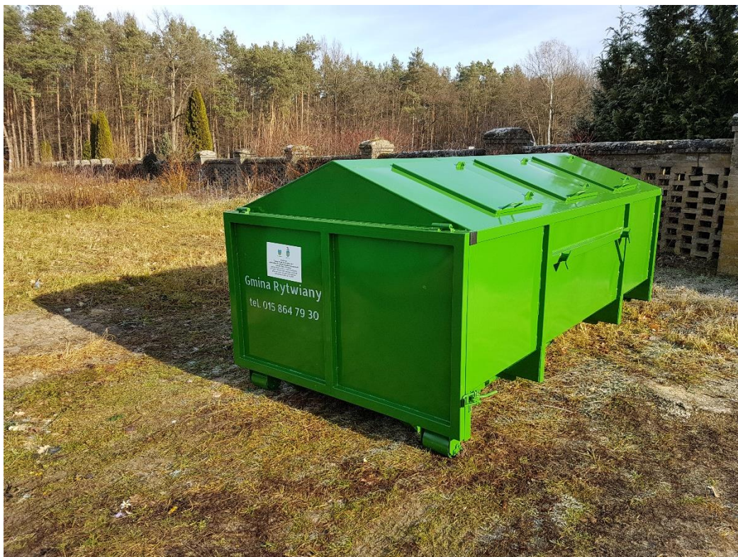
Rysunek 2. Nowy kontener KP-7 przy cmentarzu w Rytwianach