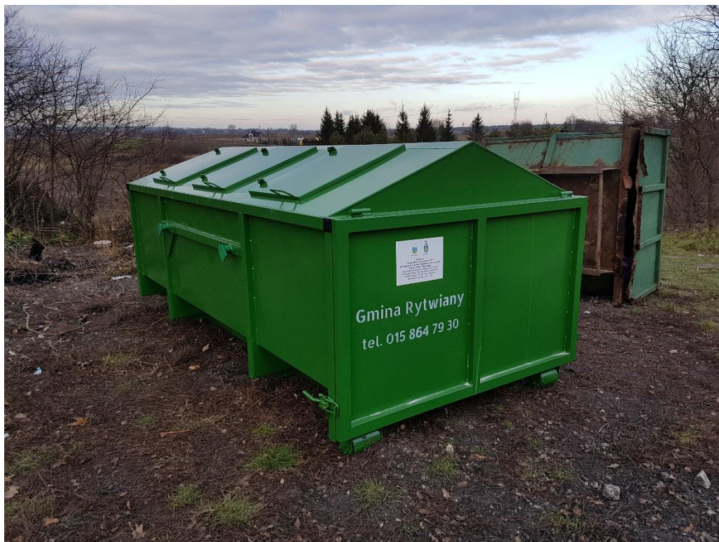
Rysunek 1. Nowy kontener KP-7 pod blokami w Sichowie Dużym. W tle stary, zniszczony kontener.

Wylimitowanie zużytych kontenerów poprawiło estetykę ich usytuowania w zabudowie infrastruktury wiejskiej, zlikwidowało problem uciążliwości zapachowych pochodzących z kontenerów oraz przesiąkania z kontenerów do gruntu skażonych wód opadowych. Ponadto, szczelne poszycie i dobrze funkcjonujące pokrywy wyspowe przyczyniają się do wylimitowania problemu roznoszenia śmieci przez zwierzęta. Usprawniona została także obsługa techniczna odbierania odpadów z kontenerów.