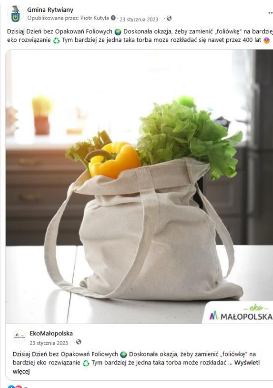
Fig. 4. Przykładowe artykuły w ramach edukacji ekologicznej przeprowadzanej za pomocą fanpage Gminy Rytwiany na portalu społecznościowym Facebook.