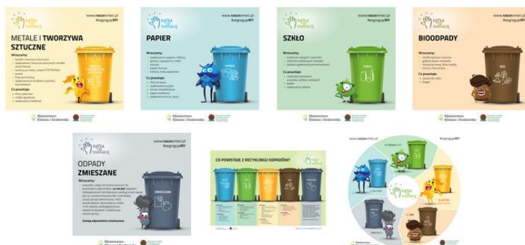
Fig. 3. Przykładowy artykuł w ramach edukacji ekologicznej przeprowadzanej za pomocą strony internetowej Gminy Rytwiany.